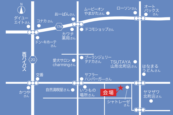
会場 / 山形市江俣3丁目17番 地内