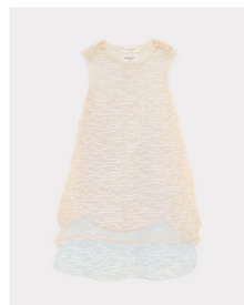
Kazuyo Sejima x Sonia Rykiel Limited Edition Dress