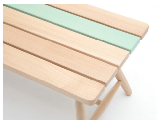
Taiji Fujimori Atelier X KARIMOKU “ensemble”