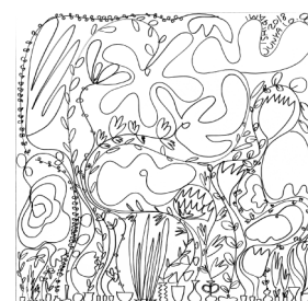
Junya Ishigami Drawing